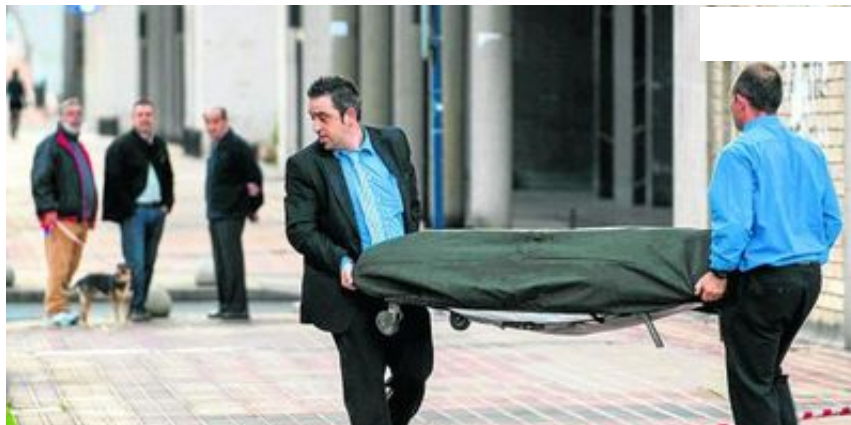
La crisi incrementa els problemes de salut mental